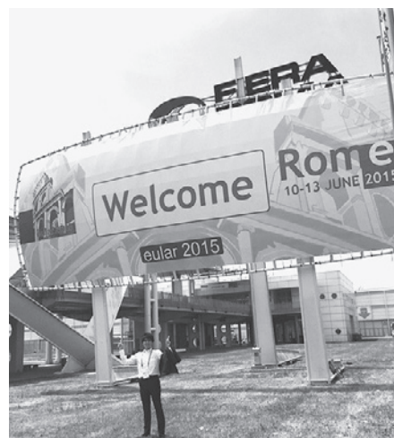
Fiera di Roma にて

さて、学会会場である Fiera di Roma は、大きな建物が Hall 1～10 まで一直線の通路の両脇に立ち並んでいた。ちょうど中心にあるポスター会場に到着した頃には汗ばむくらいの陽気になった。ポスター会場の雰囲気は、集合写真を撮っていたりと国内の学会に比べるとやや明るく感じた。ポスターセッションを中心に各国の研究者の報告を見ていると、リウマチ膠原病疾患において著しい治療効果をあげた生物学的製剤に関する発表が今年も多かった。それらの大規模臨床試験の結果が多く発表されており、さらに新たな治療ターゲットを模索する生理活性物質に関する基礎的な研究が目立っていた。新しい知見を紹介するセッ