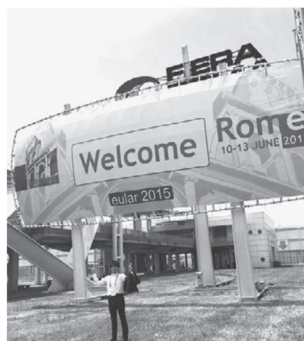
Fiera di Roma にて

さて、学会会場である Fiera di Roma は、大きな建物が Hall 1～10 まで一直線の通路の両脇に立ち並んでいた。ちょうど中心にあるポスター会場に到着した頃には汗ばむくらいの陽気になった。ポスター会場の雰囲気は、集合写真を撮っていたりと国内の学会に比べるとやや明るく感じた。ポスターセッションを中心に各国の研究者の報告を見ていると、リウマチ膠原病疾患において著しい治療効果をあげた生物学的製剤に関する発表が今年も多かった。それらの大規模臨床試験の結果が多く発表されており、さらに新たな治療ターゲットを模索する生理活性物質に関する基礎的な研究が目立っていた。新しい知見を紹介するセッ