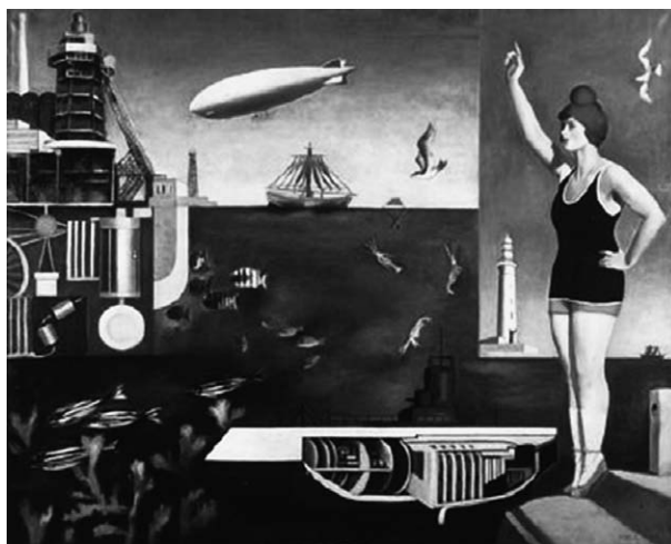
図 2 古賀春江「海」(1929年) 東京国立近代美術館所蔵

アメリカの女優、グロリア・スワンソンであるが、このポーズはハリウッド映画「雨中の逃亡」(1917年)で彼女が見せたものだ。その映像を転載した絵葉書『原色写真新刊西洋美人スタイル(八枚組)第9集』(青海堂、発行年は特定できず)が、ここに描かれた摩登ガールの原像とされる。現実ではなく、スクリーン上でのみ像を結ぶ女優はすでに「不在」を宿命づけられた存在だが、そのイメージが幾層ものメディアを通じて、このタブローに落とされた。摩登ガールの像だけではなく、ここに描かれた工場や飛行船(ドイツのツェッペリン伯号)のイメージも、当時の科学雑誌に掲載された写真が典拠だ。