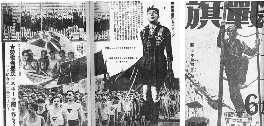
図3 「戦旗」(1929年6月号)表紙とグラビアページ。

プロレタリア文学運動が最も勢いを持った1930年前後、例えばナップ(NAPP、全日本無産者芸術連盟)の機関誌「戦旗」にしばしば用いられた労働者と工業物が重ねて表象されたグラフィズムは、こうした「頑強な身体」への期待が込められていたと考えていだろう(図3)。同誌のグラビアページに登場する、ソビエトロシアの労働者たちとスポーツの結びつきもまた、鉄骨やコンクリート同様に鍛えられた身体が、やがては「病んだ近代」から脱するための革命を樹立させるというメッセージをまとめて読者に提供されていく。だがここで考えねば