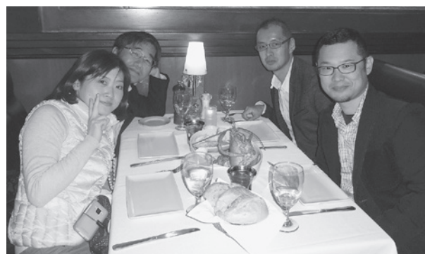
ロブスターを前に

を学会で行っており、筆者も実際に参加したりインストラクターとして参加する機会を頂いているが、やはり他国ではどのように行っているか、そして何か新しい発見はない