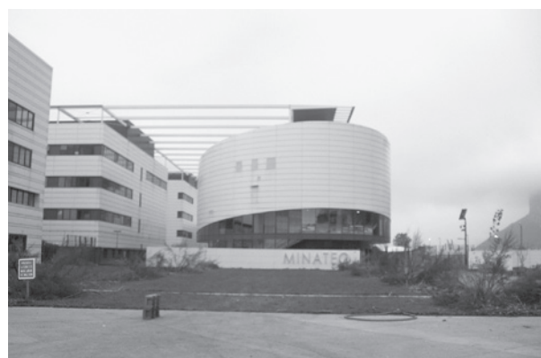
学会会場であるフランス グルノーブルにあるMINATEC