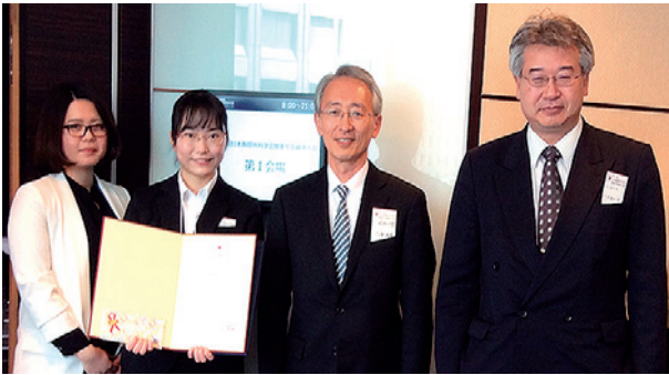
図4 第176回 日本胸部外科学会 関東甲信越地方会 学生発表最優秀賞の受賞

年度 日本肺癌学会 篠井・河合賞受賞をはじめ(図1), 2017年度には, 日本外科学会 若手外科医のための臨床研究助成 (JSS Young Researcher Award)(図2), 東邦大学医学部 柴田洋子奨学助成金を当教室員が受賞した。学位の早期取得にも取り組んでおり, スタッフ8名中6名が学位を取得している。