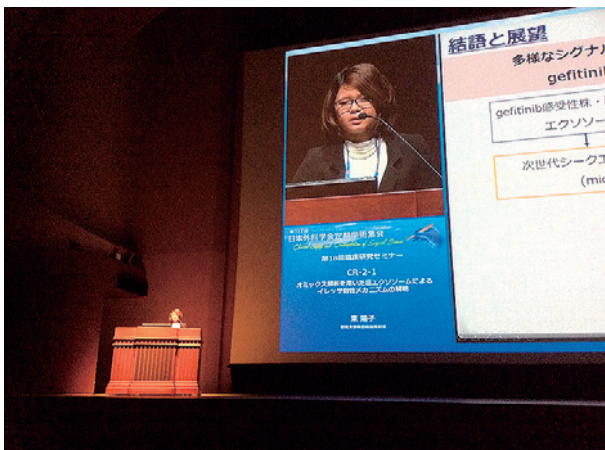
図2 2017年度日本外科学会 若手外科医のための臨床研究助成受賞講演