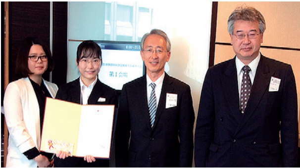
図4 第176回 日本胸部外科学会 関東甲信越地方会 学生発表最優秀賞の受賞

年度 日本肺癌学会 篠井・河合賞受賞をはじめ(図1), 2017年度には, 日本外科学会 若手外科医のための臨床研究助成 (JSS Young Researcher Award)(図2), 東邦大学医学部 柴田洋子奨学助成金を当教室員が受賞した。学位の早期取得にも取り組んでおり, スタッフ8名中6名が学位を取得している。