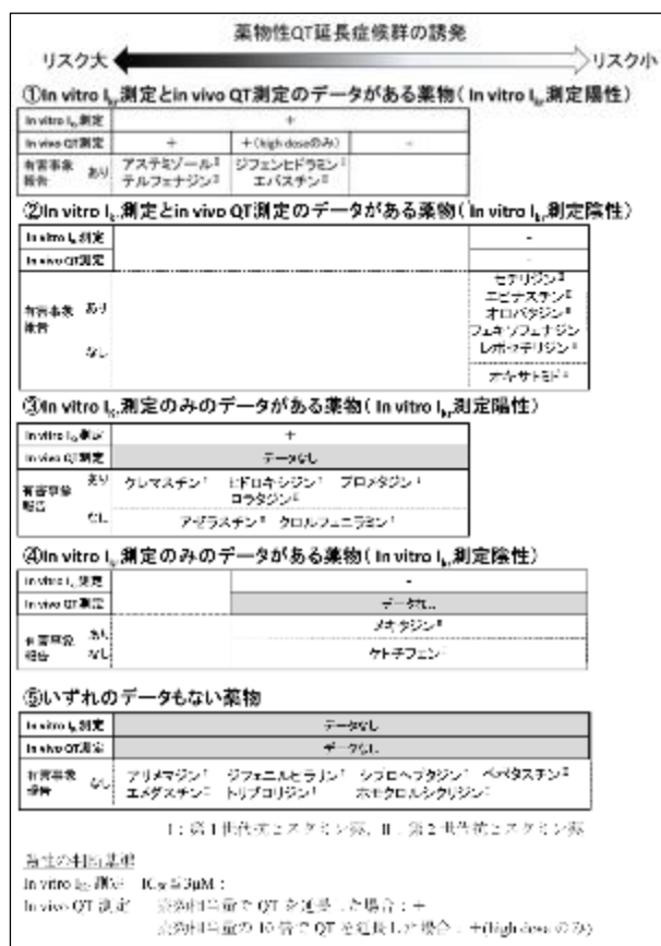
図 1 抗ヒスタミン薬の心臓電気薬理学的データの有無と薬物性 QT 延長症候群の誘発リスク