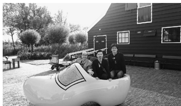
“風車の村”と呼ばれるオランダの観光スポット Zaanse Schans にて

学会はというと、ヨーロッパ最大級の呼吸器学会であり、当然ヨーロッパ各国からの参加者が大多数でしたが、アジアや北米からの参加者の姿も見られました。成人領域における結核や慢性閉塞性肺疾患(chronic obstructive pulmonary disease: COPD)に関する演題が中心であり、小児領域の演題は数少ない印象が否めませんでした。その中で、