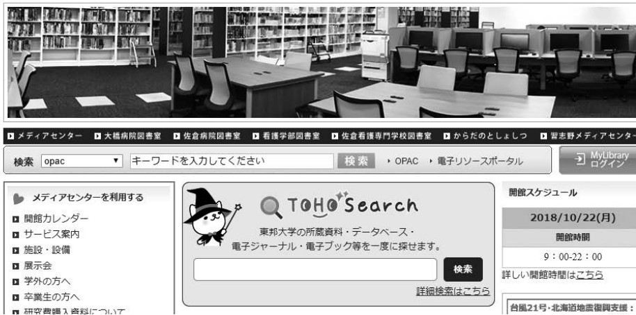
図2 Summon 検索窓