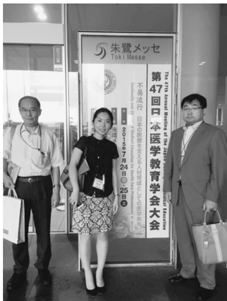
Fig. 1 第47回日本医学教育学会大会（新潟朱鷺メッセ）にて

卒前卒後のコンピテンシー，教育業績評価，多職種連携教育（interprofessional education：IPE），シミュレーション教育についての現状と問題点，今後の方策を中心に報告する（Fig.1）。