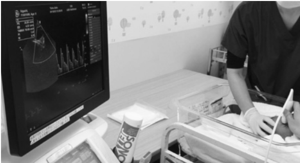
図1 新生児眼動脈 color Doppler imaging (CDI) 眼瞼の上から探触子をあて視神経乳頭後方の眼動脈を測定する。

手技的にはカプト点眼変法（塩酸フェニレフリン 2.625%，トロピカミド 0.125%，シクロペンサート 0.25%）にて散瞳後、睡眠中の児の眼瞼を指で眼球を圧迫しないように開瞼し、新生児用に改良したLSFG（図2）を静かに近づけ、視神経乳頭を目安に3~4秒間撮影を行う。視神経乳頭にラバーバンドを設定して解析（図3）し、1心拍あたりの網膜血流速度の指標で血流量を反映（mean blur rate：MBR）、血流波形解析〔体循環の状態を表す指標歪度（skewness）、1心拍中の血流量の評価（blowout score：BOS）、1心拍中に高い血流が維持されているかの評価（blowout time：BOT）など〕を行う。