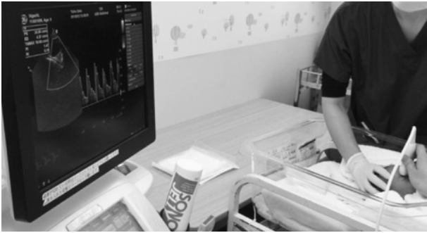
図1 新生児眼動脈 color Doppler imaging (CDI) 眼瞼の上から探触子をあて視神経乳頭後方の眼動脈を測定する。

830 nm のレーザー光を照射し、網膜血管の赤血球のスペックルパターンの時間変動を計測し眼底の血流量を測定する検査である 5) 。非侵襲的でリアルタイムに眼底の広い範囲をモニタリングでき、その中の任意の点や領域の血流を画