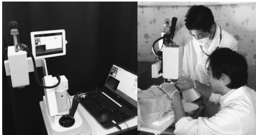
図2 左: 新生児用 laser speckle flowgraphy (LSFG), 右: 測定風景 睡眠中の新生児の眼瞼を優しく開け測定を行う。検査には3人必要である。

現在までに、新生児に対してCDIを用い、未熟児網膜症の軽症例と重症例での網膜中心動脈の血流の比較を行っ