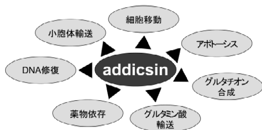
図 1 Addicsin の生理機能

これらの結果は、addicsin が addicsin-TR1 複合体形成する事で、小胞体から細胞膜への TR1 の細胞内輸送能と TR1 の細胞膜発現量を制御し、細胞移動能の変化を引き起こす事を示唆する。