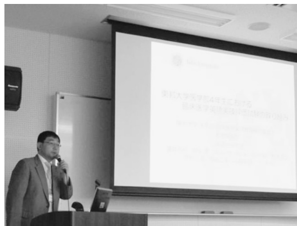
Fig. 1 発表する筆者

紀州藩に縁の深い華岡青洲のことは「活物窮理—医学教育の本質を求めて」と「Globalization and Identity of Future Japanese Medical Education」を基調テーマとして開催され、その主旨は「分野別質保証、新専門医制度を踏まえた医学教育の潮流」をいかに理解し、本邦の現状に合わせて対応していくかであった。答えは1つではないが、その意識を共有しようという3000人弱の、全国の医学部教員の1割にも満たない数ではあるが、熱意と情熱にあふれた教員が集まり議論が展開された。本稿ではその一端を東邦大学医学部教職員と共有すべく報告する。