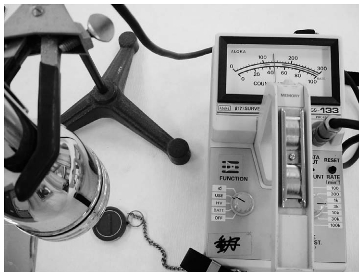
図1 密封線源(校正用 ^{226}\text{Ra} )からの放射線量を測定する様子 写真にある丸いものが校正用線源。金属とアクリルで完全に密閉されていて、通常の扱いでは放射性物質が外部へ漏れることはない。線源の上に遮蔽用の板を1枚ずつ徐々に重ねて置き、その都度サーベイメーターの指示値を読む。実験の操作は極めて単純である。