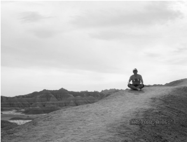
サウスダコタ州バッドランズ国立公園，世界は広い。

Society of Nephrology (ASN) Kidney Week 2012, San Diego, CA, USA, 30th October-4th November, 2012] が開催され，そこで3つの演題を報告した。世界から約5000演題が申し込まれ，oral 採択率約8%という難関を2つクリアすることができた。仲間は「Big deal !」と称えてくれ