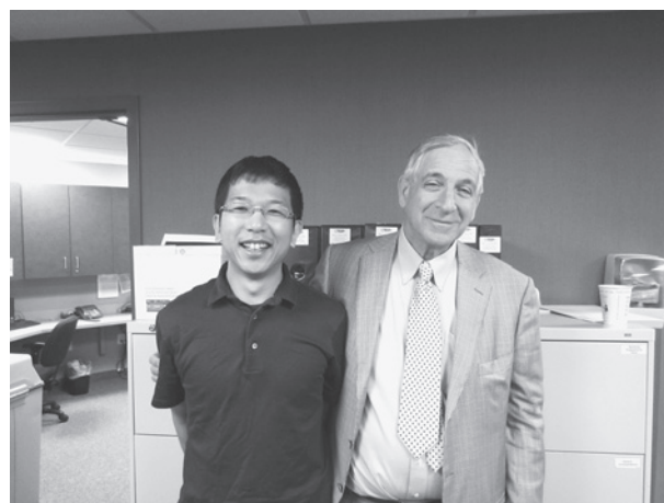
Maron 先生. 心筋症の大家で Maron 分類を作成した人. 隣の部屋で仕事をしており英語の勉強は進んだかと声をかけてくれる。