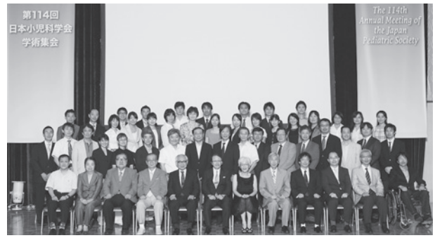
当センターが主催した第114回日本小児科学会学術集会(2011年8月)での集合写真

小児の総合診療科として、こどもの身体的、精神的、社会的な健康を守るため、「東邦大学小児医療センター」の中核的位置にあり、小児の総合診療科として社会に貢献する