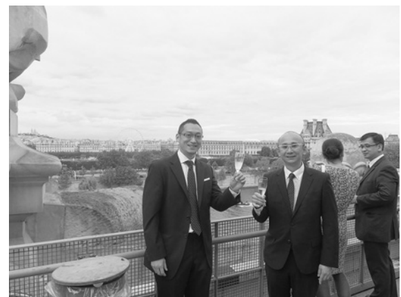
オルサー美術館での Gala Dinner

急性胆嚢炎に対しては早期の腹腔鏡手術が推奨されている。特に国際版は「Tokyo Guidelines」という名称で、そ